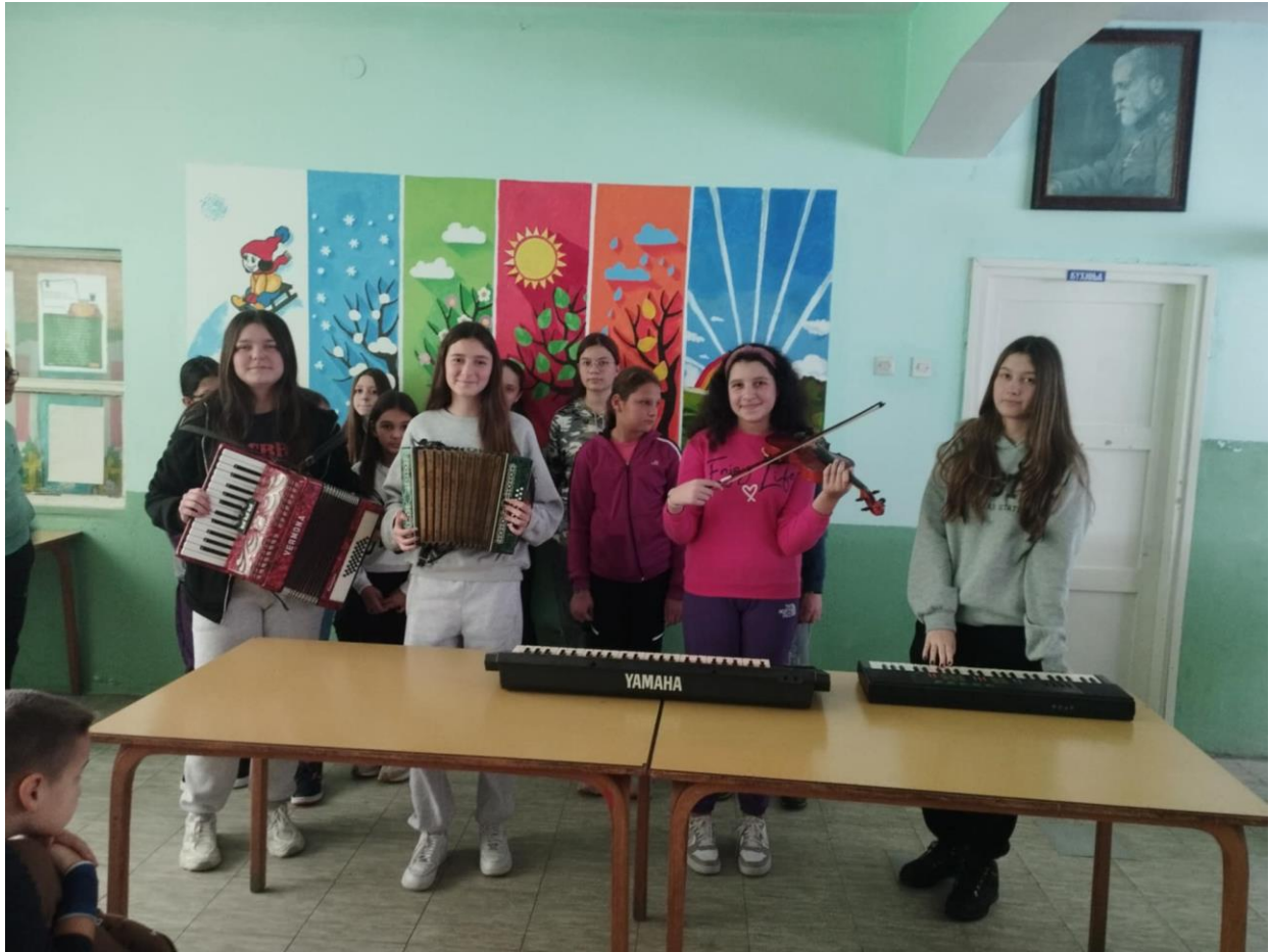
На фотографији – ученице ОШ „ Војвода Радомир Путник.

Деца наступају - свирају, певају, плешу (реализатор наставник Музичке културе).